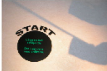
Samtliga bilder: Lek & Lögn, blandade material, 2006-08